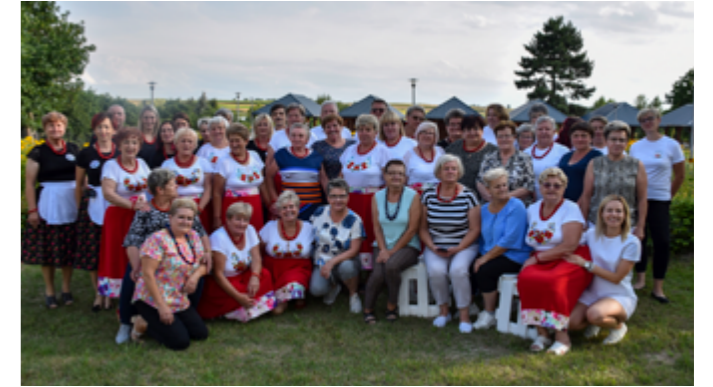
Spotkanie KGW z projektu „W KGW Siła”, Boniewo, 21.07.2023r.