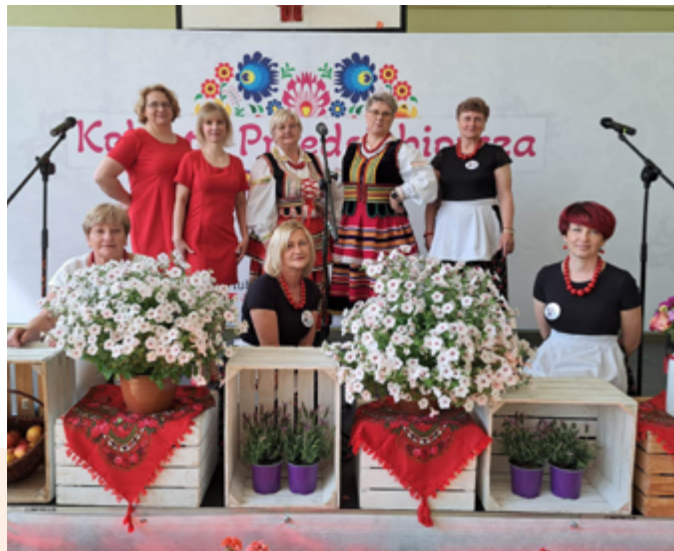
Gala fianłowa konkursu, Kobieta Przedsiębiorcza, Krasnystaw, 28.05.2023r.