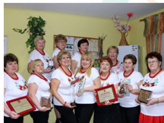
Siedziba Gminnego Stowarzyszenia Aktywnych Kobiet w Fajslawicach, Fajslawice, 16.10.2020r.