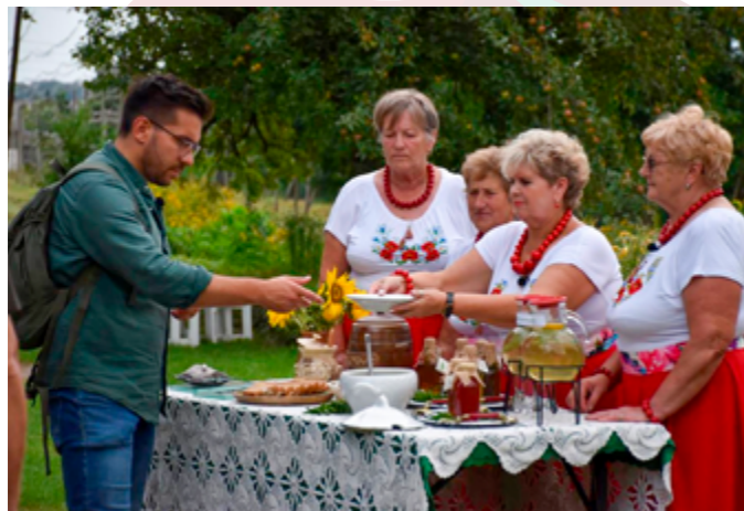
Nagranie do programu Naturalnie Lubelskie, Boniewo, 28.08.2023r.