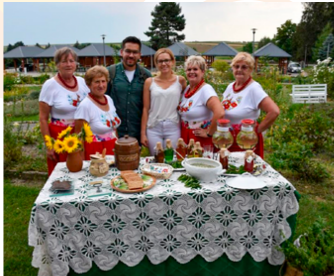
Nagranie do programu Naturalnie Lubelskie, Boniewo, 28.08.2023r.