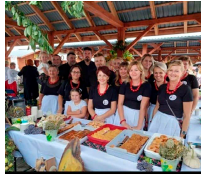
VIII Wojewódzkie Święto Ziół, Boniewo, 15.08.2022r.