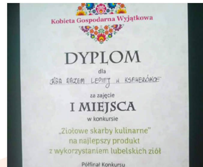
Półfinał konkursu „Kobieta Gospodarna Wyjątkowa”, Chełm, 2021r.