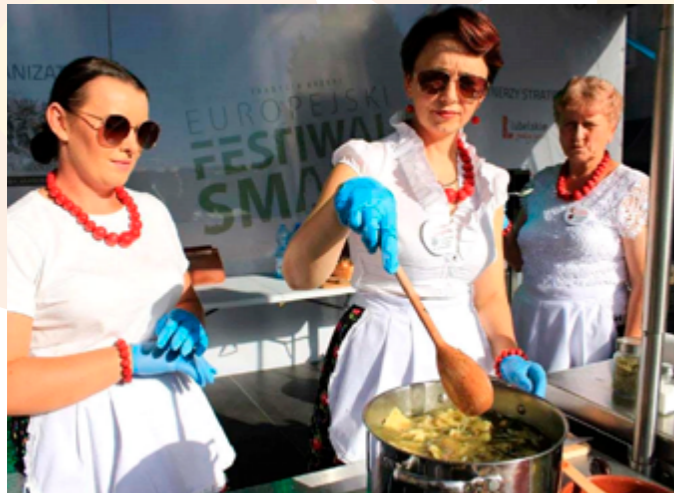
Europejski Festiwal Smaku, Lublin, 10.09.2023r.