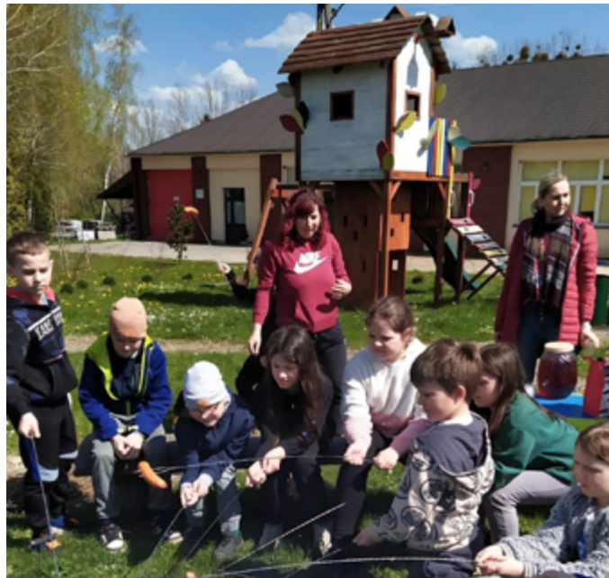
Akcja sprzątania świata z uczniami Szkoły Podstawowej w Siedliskach Drugich, 2023r.