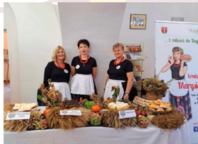
Noc Bibliotek, Krasnystaw, 06.10.2023r.