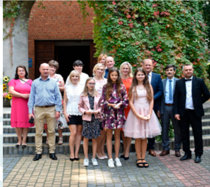
Dożynki Parafialne, Siedliska Drugie, 2021r.