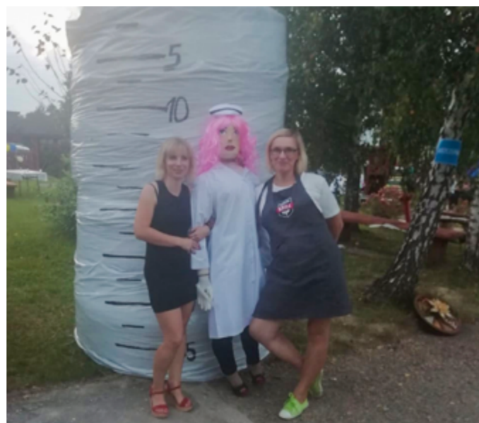
Festyn „Szczepimy się”, Ksawerówka, 2021r.