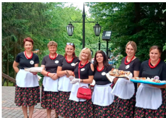
Przygotowanie poczęstunku podczas odpustu parafialnego, Siedliska Drugie, 03.07.2022r.