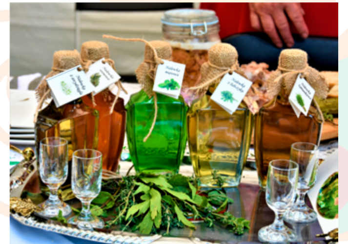
Nasze Kulinarne Dziedzictwo - Smaki Regionów, Janowiec nad Wisłą, 06.08.2023r.