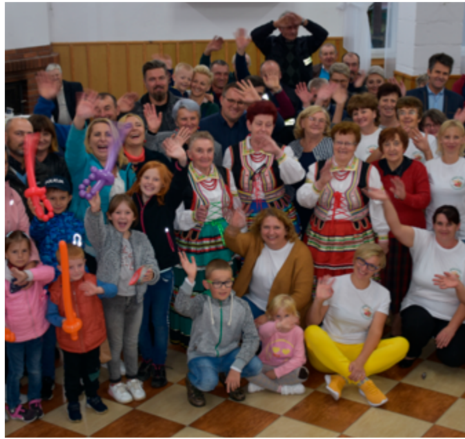
Ksawerowskie Pożegnanie Lata, 2022r.