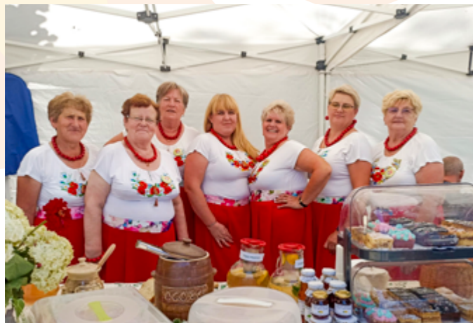
Konkurs Nasze Kulinarne Dziedzictwo Smaki-Regionów, Zamek w Janowcu, 06.08.2023r.