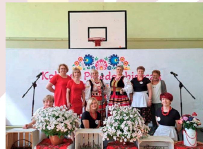
Eliminacje Konkursu „Kobieta Przedsiębiorcza”, Krasnystaw, 28.05.2023r.