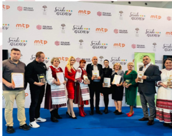
Finał konkursu Nasze Kulinarne Dziedzictwo - Smaki Regionów, Poznań, Międzynarodowe Targi Poznańskie, 09.2022r.