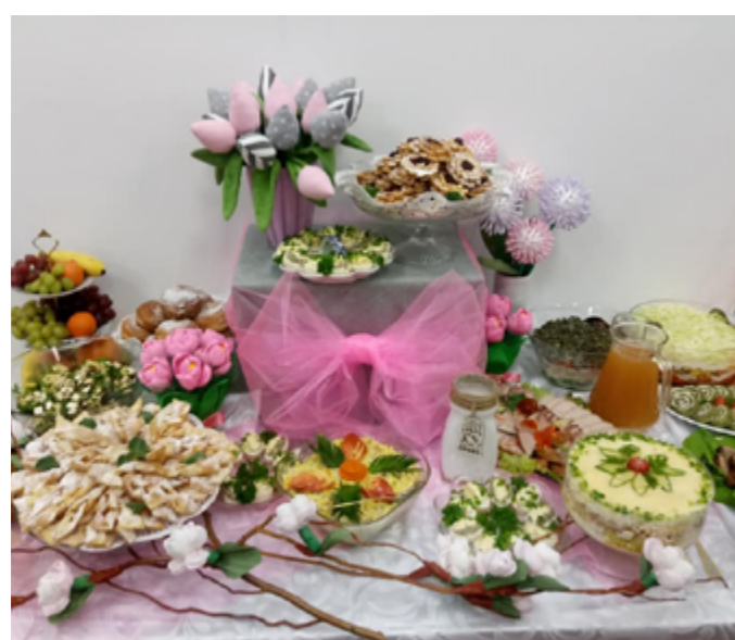
Festiwal Pączka i Faworka, Siennica Nadolna, 2019r.