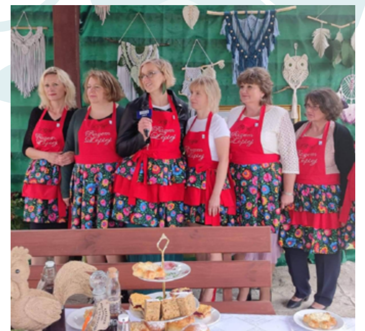
Wizyta TVP 3 Lublin, Ksawerówka, 2022r.