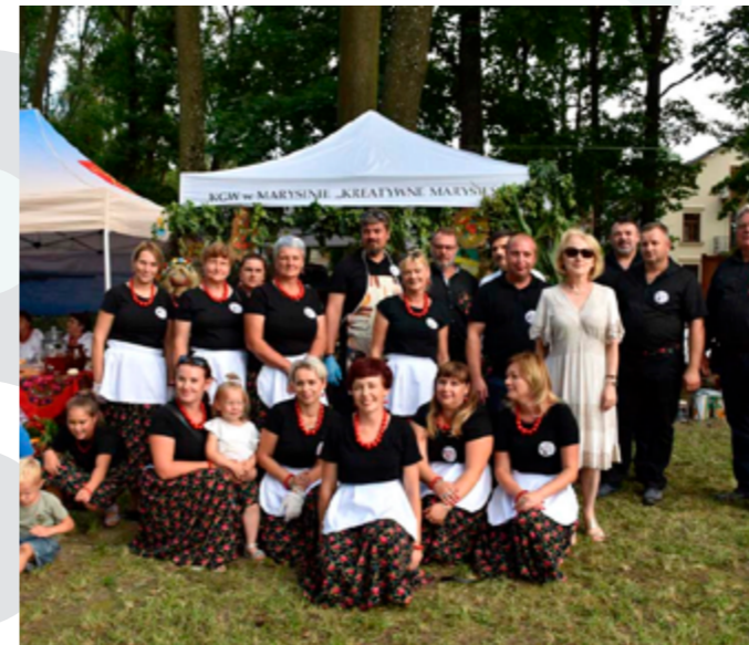
IV Jarmark Królewski, Rybczewice, 21.08.2022r.