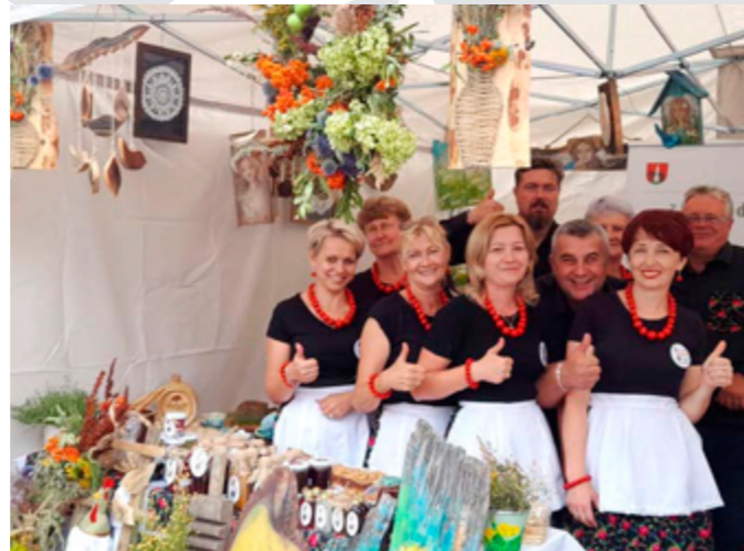
Eko piknik, I miejsce w konkursie kulinarnym za paszety z ziołami, Krasnystaw, 31.07.2022r.