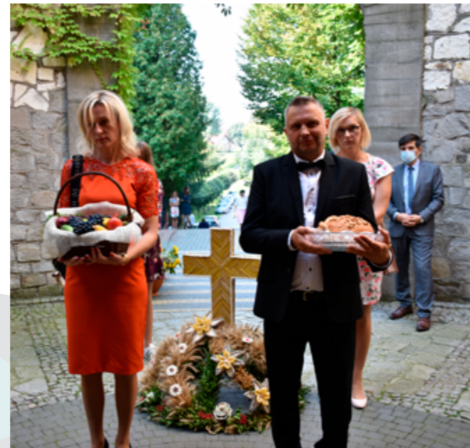
Dożynki Parafialne, Siedliska Drugie, 12.09.2021r.