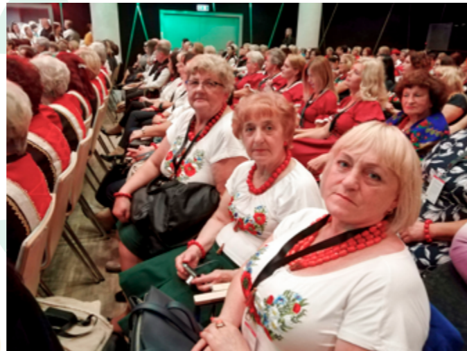
Gala fianłowa konkursu „Kobieta Gospodarna Wyjątkowa”, Lublin, 2019r.