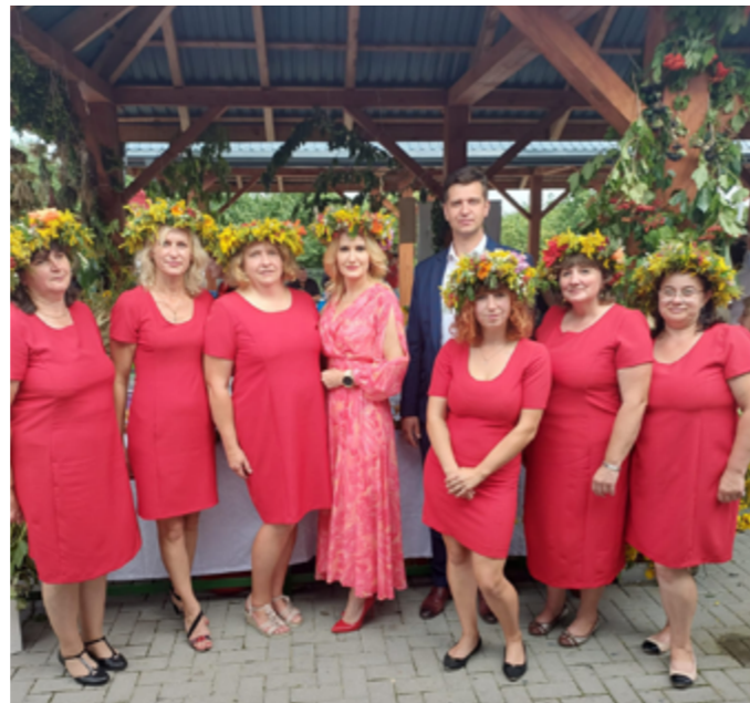
VIII Wojewódzkie Święto Ziół, Boniewo, 2022r.