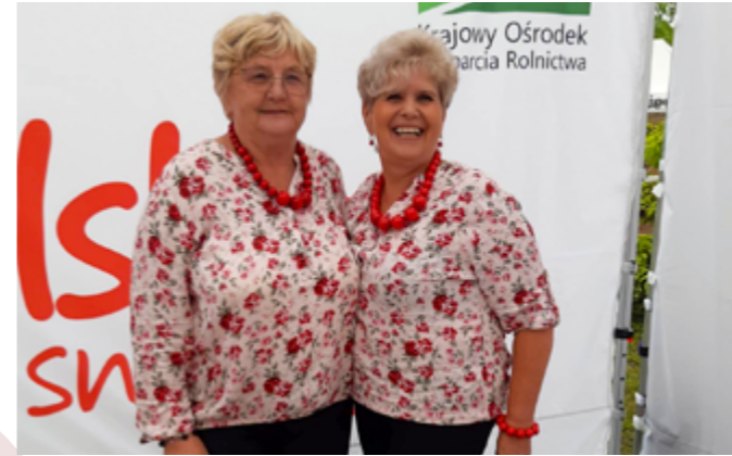
Eliminacje do konkursu Bitwa Regionów, Krasnystaw, 10.06.2023r.