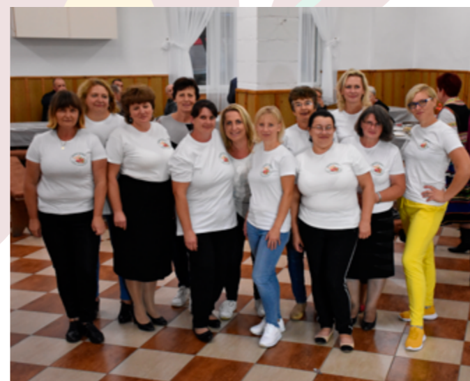
Ksawerowskie Pożegnanie Lata, 2022r.