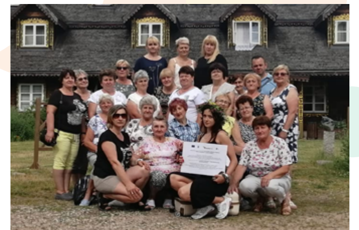
Wyjazd studyjny, Koryciny, 27.06.2021r.