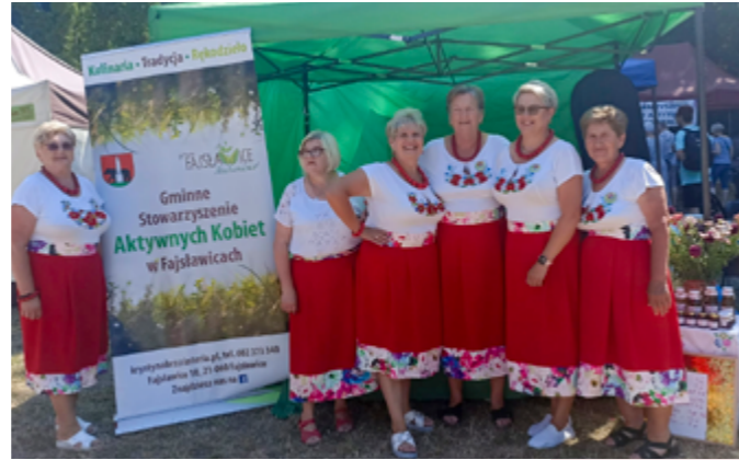
Na kulinarnym szlaku wschodniej Polski, Nałęczów, 09.07.2023r.