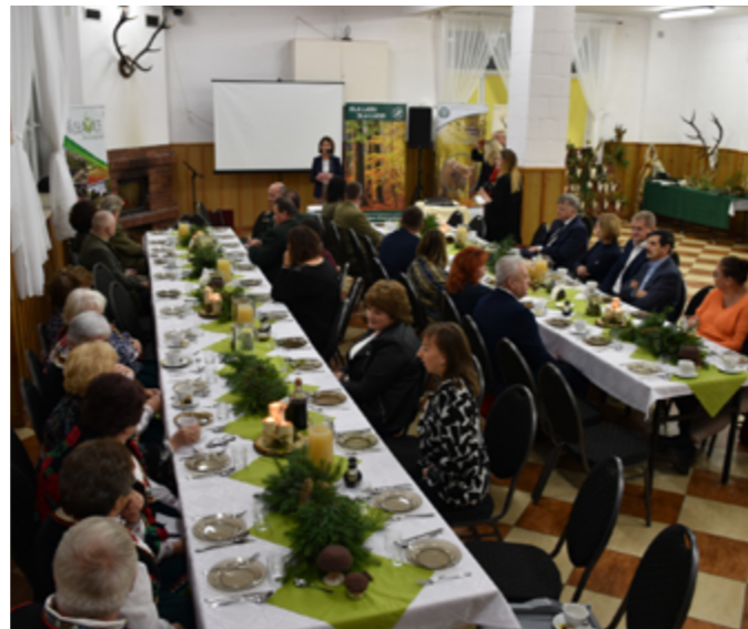
Ksawerowskie specjały z lasu, Ksawerówka, 2022r.