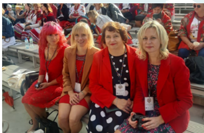
Gala Finałowa konkursu „Kobieta Gospodarna Wyjątkowa”, Chełm, 2021r.