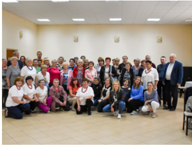
Wyjazd studyjny z projektu W KGW Siła, Kodeń, 03.06.2023r.