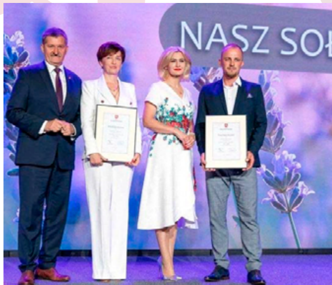
Gala finałowa „Nasz Sołtys”, Lublin, 11.09.2023r.