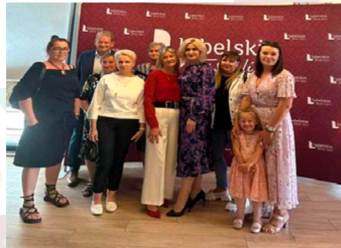
Konferencja „PROW wspiera lubelską wieś”, Urszulin, 29.09.2023r.