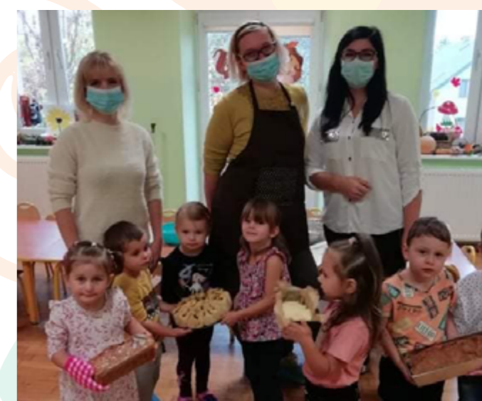
Dzień Chleba, Przedszkole Małych Odkrywców, Piaski, 2021r.