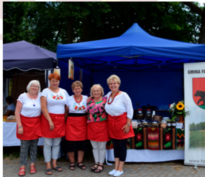
Dni Żółkiewki, 2019r.