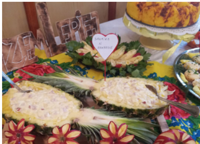
Festiwal „Smaki Jesieni”, Poperczyn, 2021r.