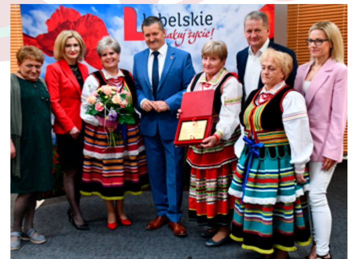
Podziękowanie za promocję Województwa Lubelskiego, Lublin, 05.2023r.