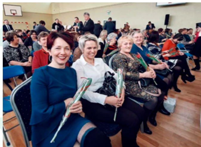
Dzień Kobiet, Krasnystaw, 03.2023r.