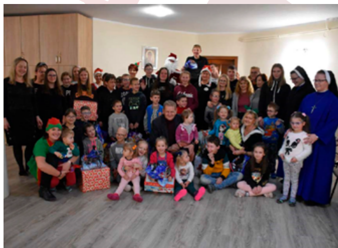
Mikołajki w Placówce Opiekuńczo-Wychowawczej „Nasz Dom”, Tuligłowy, 06.12.2022r.