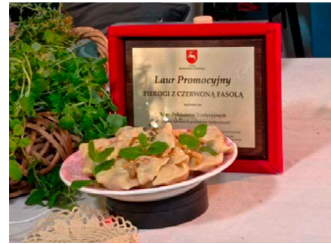
Laur Promocyjny za Pierogi z czerwoną fasolą.