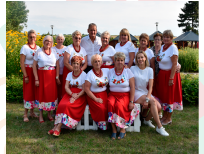
Spotkanie KGW z projektu „W KGW Siła”, Boniewo, 21.07.2023r.