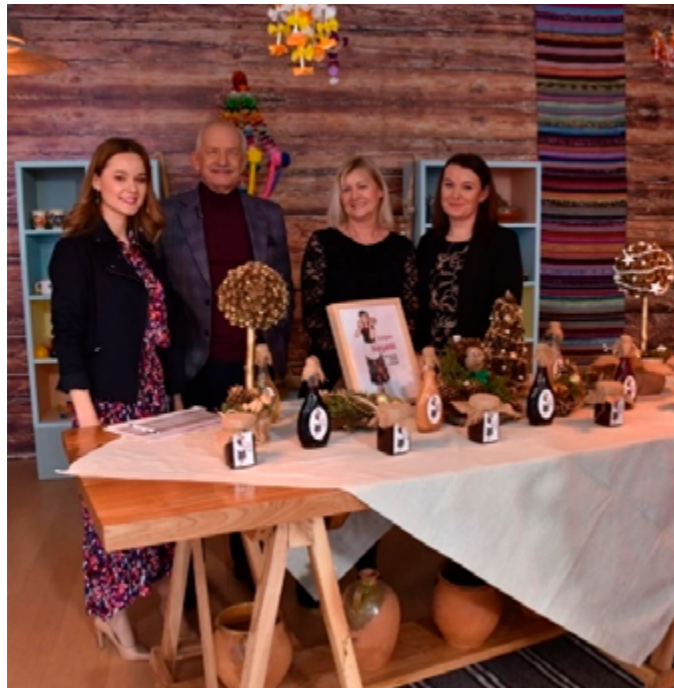
Wizyta w programie „Poranek między Wisłą i Bugiem” w TVP 3 Lublin, 25.01.2022r.