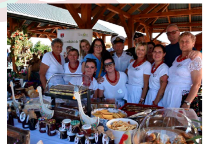
IX Wojewódzkie Święto Ziół, Boniewo, 15.08.2023r.