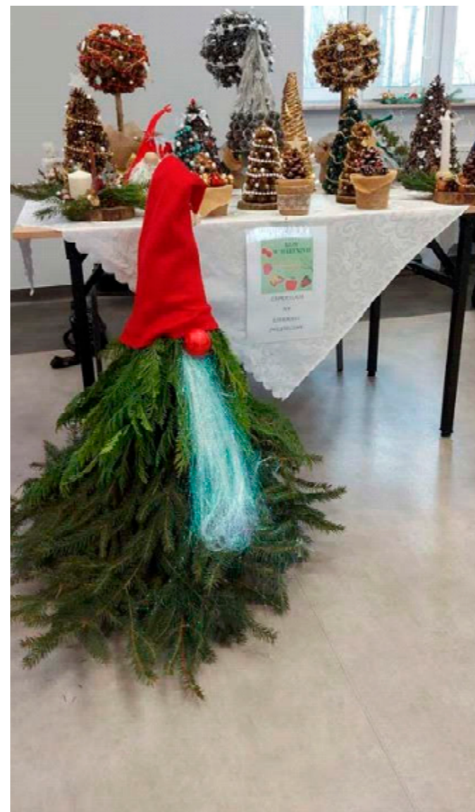
Kiermasz w Gminnym Ośrodku Kultury, Fajslawice, 12.01.2021r.