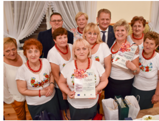
Festiwal „Smaki Jesieni”, Poperczyn, 2019r.