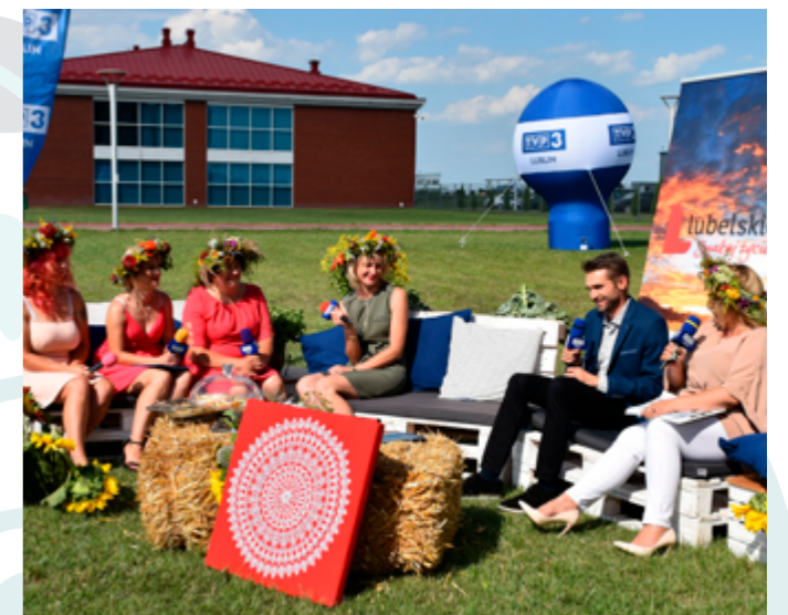
„Kobieta Gospodarna Wyjątkowa”, Chełm, 2021r.