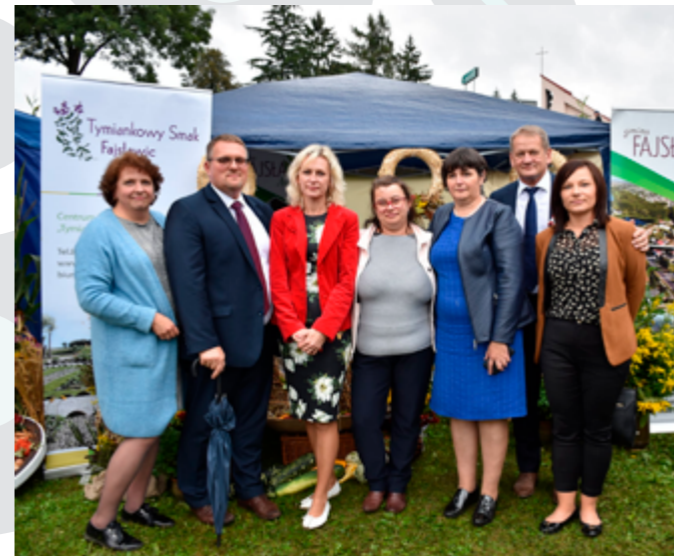
Dożynki Powiatowe, Rudnik, 2021r.