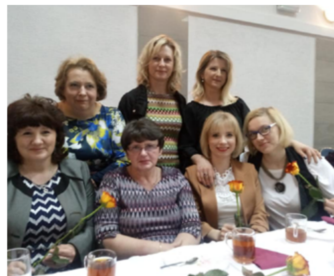
Dzień Kobiet, Fajslawice, 2020r.