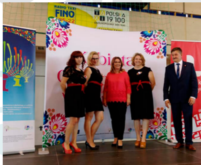
Półfinał konkursu „Kobieta Gospodarna Wyjątkowa”, Chełm, 2020r.