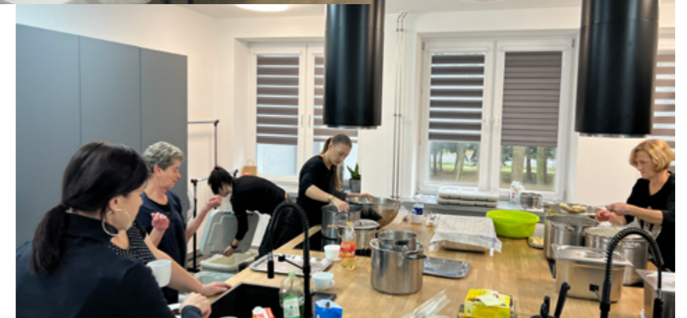
Przygotowanie poczęstunku na uroczystości gminne, 10.2023r.