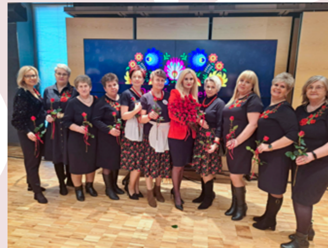
Dzień Kobiet organizowany przez Urząd Marszałkowski Województwa Lubelskiego, Lublin, 11.03.2023r.