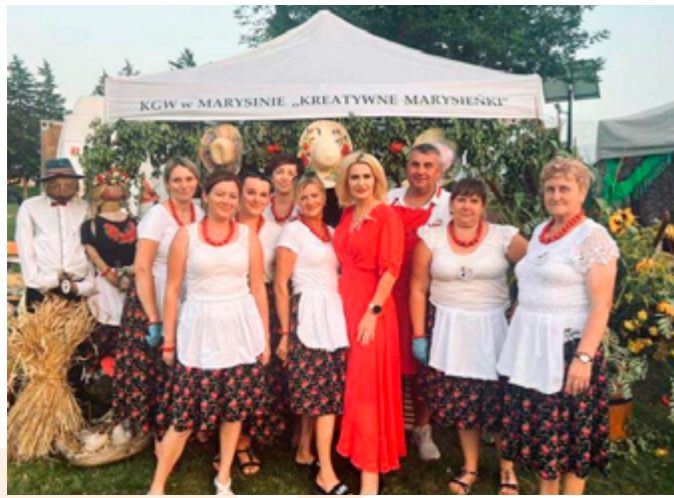
Dożynki Powiatowe, Krasnystaw, 27.08.2023r.