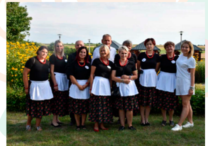
Spotkanie Kół Gospodyń Wiejskich z projektu „W KGW Siła” Boniewo, 21.07.2023r.