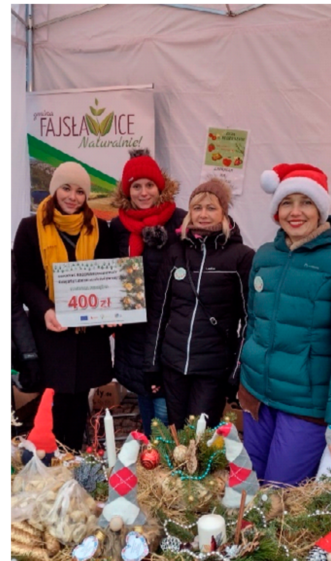
Jarmark Bożonarodzeniowy, Chełm, 18.12.2021r.