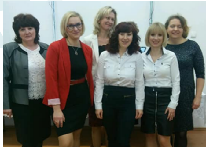
Festiwal Pączka i Faworka, Siennica Nadolna, 2019r.