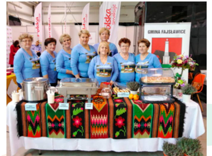
Cavaliada, Lublin, 01.02.2020r.