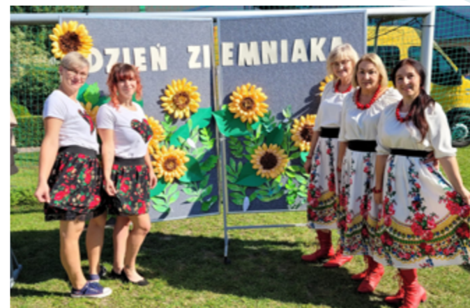
Dzień Ziemniaka w Specjalnym Ośrodku Szkolno-Wychowawczym w Krasnymstawie, Krasnymstaw, 2023r.