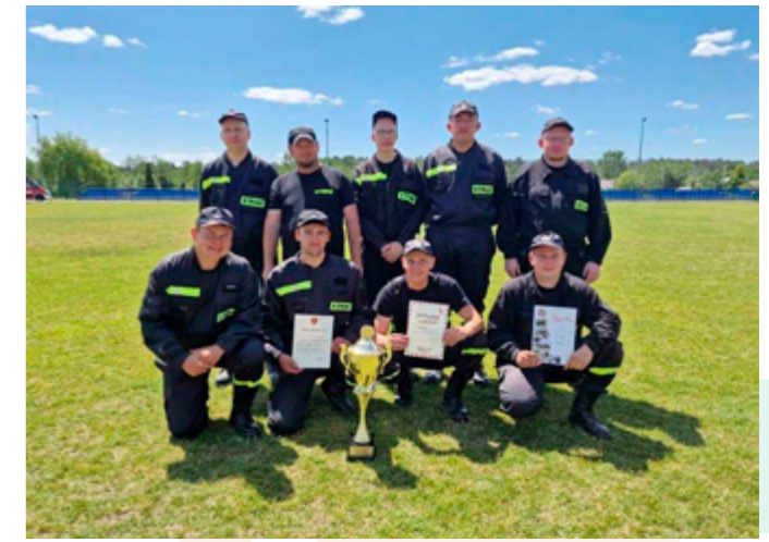
Ochotnicza Straż Pożarna w Marysinie podczas Międzygminnych zawodów sportowo-pożarniczych, Siennica Nadolna, 2023r.