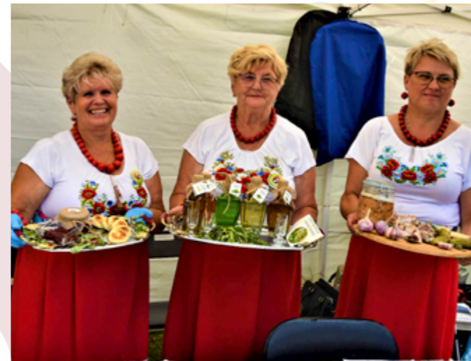
Nasze Kulinarne Dziedzictwo - Smaki Regionów, Janowiec nad Wisłą, 06.08.2023r.