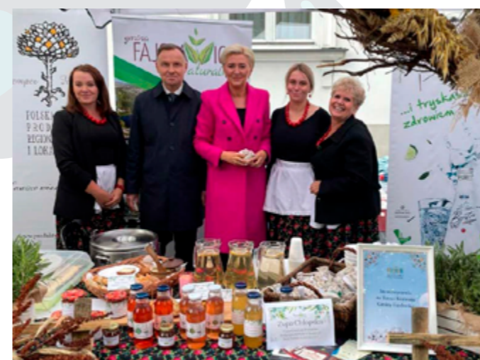
Dożynki Prezydenckie, Warszawa, 11.09.2022r.