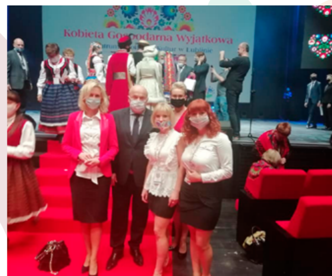
Finał Konkursu „Kobieta Gospodarna Wyjątkowa”, Lublin, 2020r.