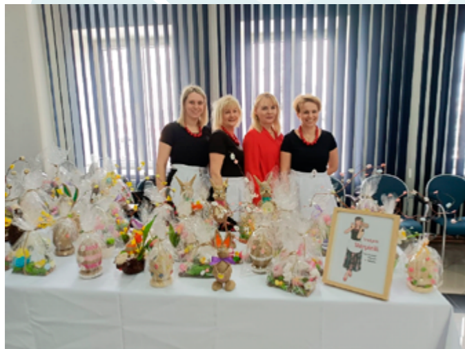
Kiermasz Wielkanocny, Urząd Gminy Fajslawice, 03.04.2022r.