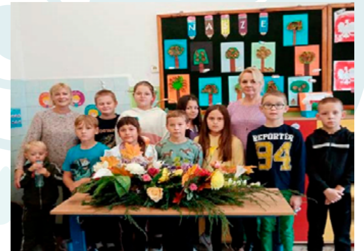
Warsztaty florystyczne w Szkole Podstawowej w Siedliskach Drugich, 27.10.2022r.