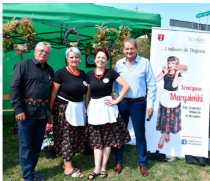
Święto Czosnku, Wyróżnienie w konkursie „Bitwa Regionów”, Rudnik, 24.07.2022r.