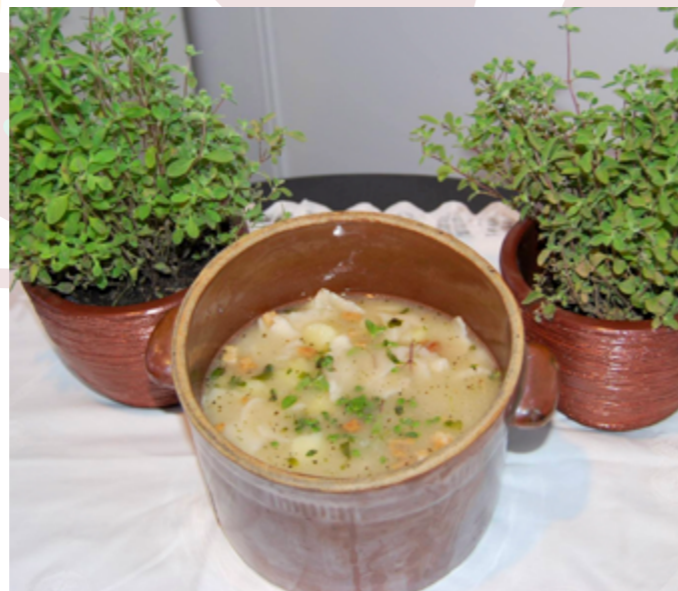
Zupa Chłopska Fajślawicka wpisana na Listę Produktów Tradycyjnych