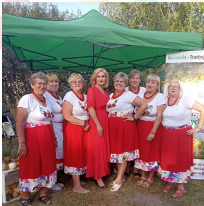
W towarzystwie Pani Dyrektora Departamentu Rolnictwa i Rozwoju Obszarów Wiejskich UMWL