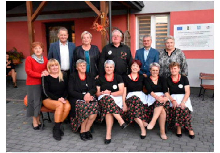
Festiwal „Smaki Jesieni”, Poperczyn, 07.10.2022r.