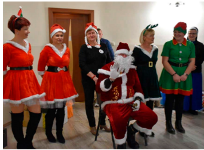
Mikołajki w Placówce Opiekuńczo-Wychowawczej „Nasz Dom”, Tuligłowy, 06.12.2022r.