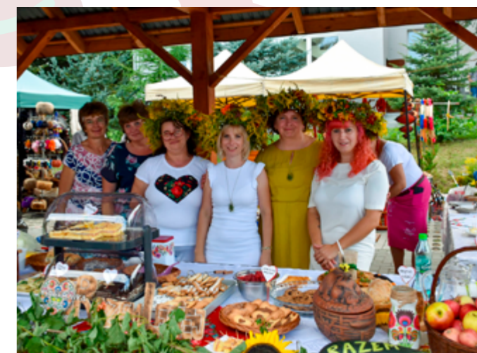
VII Wojewódzkie Święto Ziół, Boniewo, 2021r.