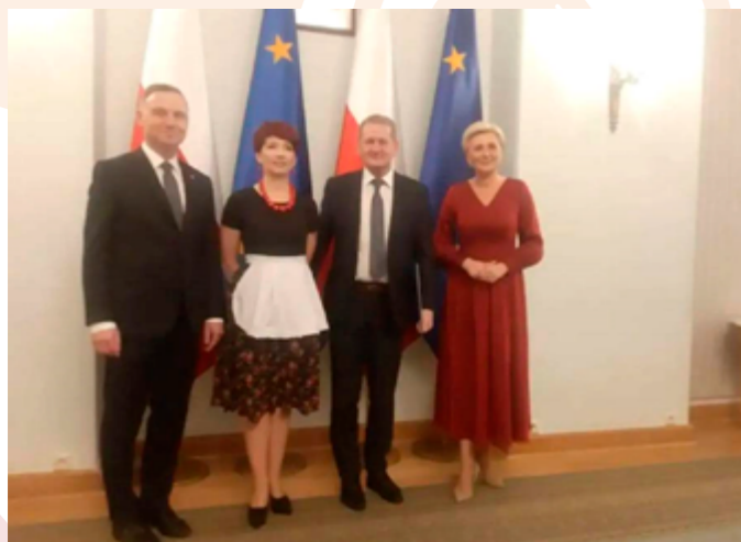
Pałac Prezydencki, Warszawa, 01.12.2022r.