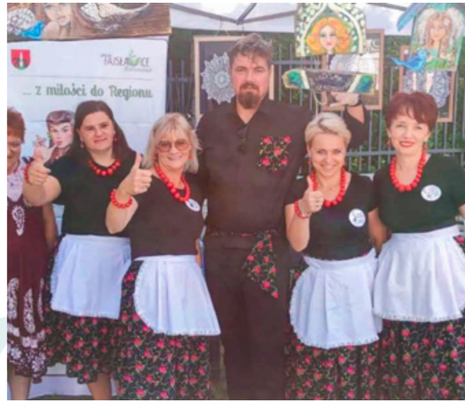
VI Festiwal Produktów Tradycyjnych i Regionalnych, Nałęczów, 23.07.2022r.