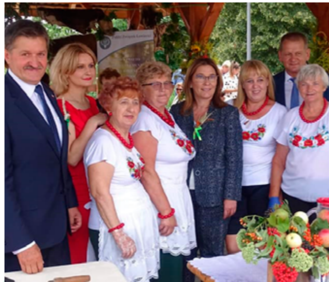
VI Wojewódzkie Święto Ziół, 2020r.