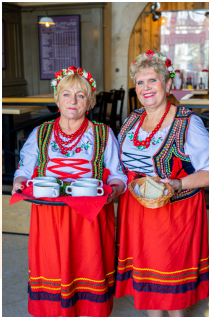
Promocja potraw i produktów tradycyjnych Województwa Lubelskiego, Kraków 09.2022r.