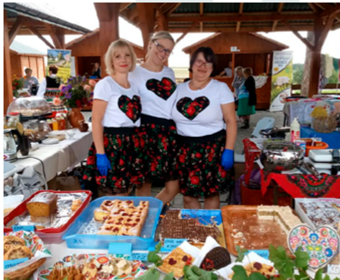
VII Wojewódzkie Święto Ziół, Boniewo, 2020r.,