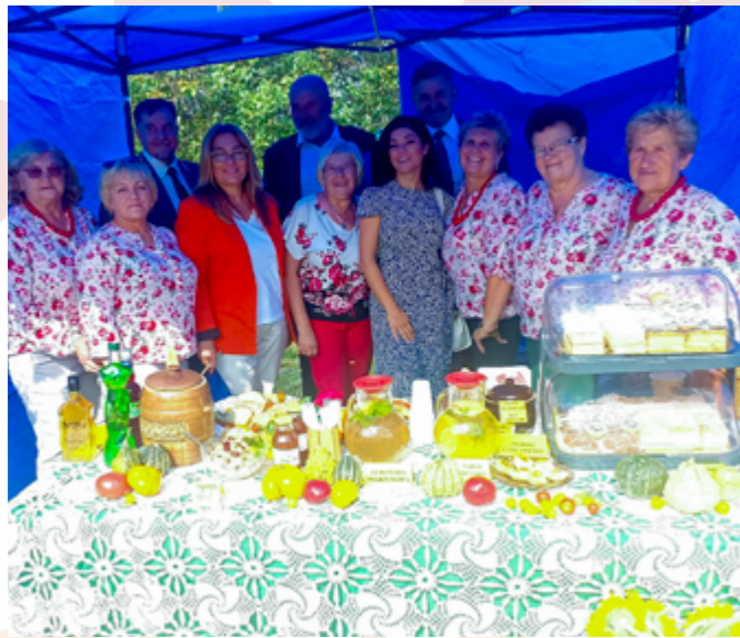
Pożegnanie Żurawi, Urszulin, 04.09.2022r.