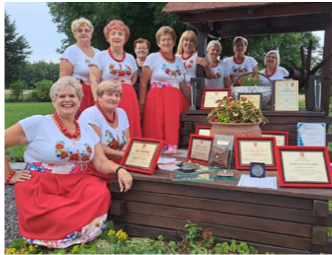
Nagrania do filmu promocyjnego z projektu „W KGW Siła”, 30.07.2023r.