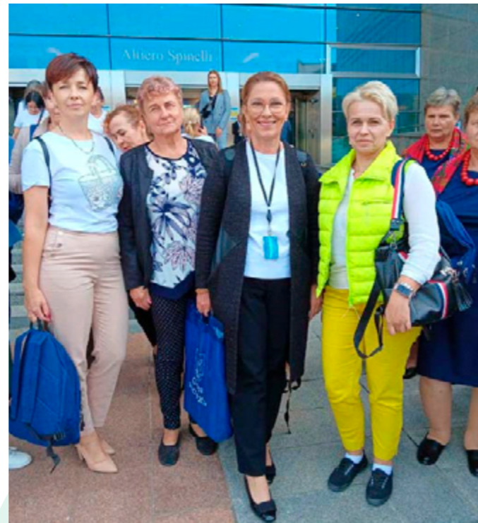
Wizyta w Parlamencie Europejskim, Bruksela, 23-27.09.2023r.