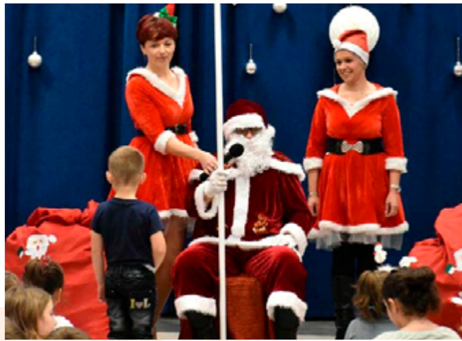
Mikołajki Gminne, Fajslawice, 04.12.2022r.