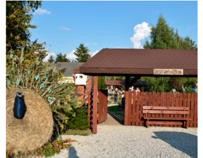
Festyn w świetlicy wiejskiej w Ksawerówce, 2021r.