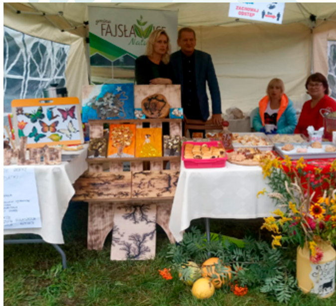
Jarmark Królewski, Rybczewice, 2021r.