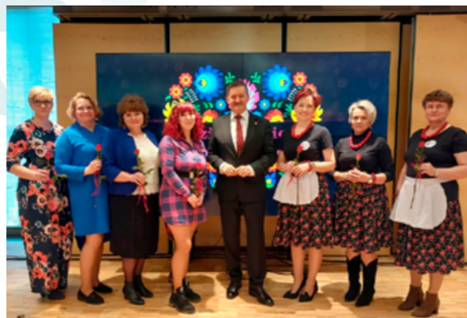
Dzień Kobiet organizowany przez Urząd Marszałkowski Województwa Lubelskiego, Lublin, 11.03.2023r.