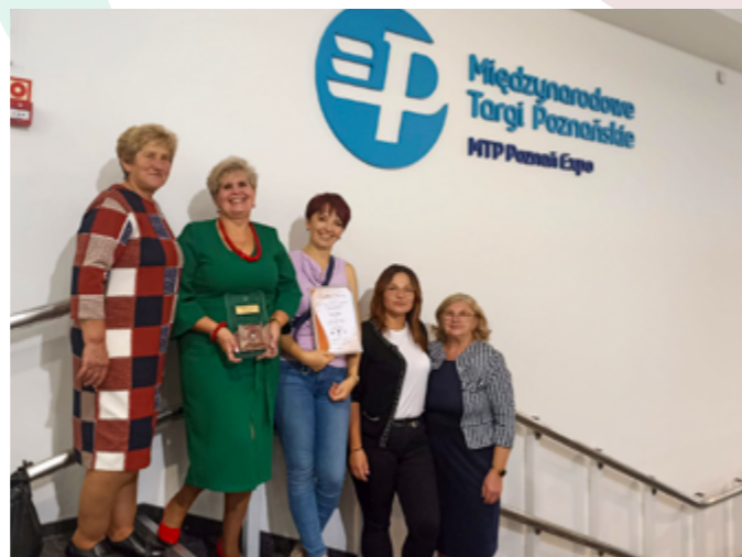
Finał konkursu Nasze Kulinarne Dziedzictwo - Smaki Regionów, Poznań, Międzynarodowe Targi Poznańskie, 09.2022r.