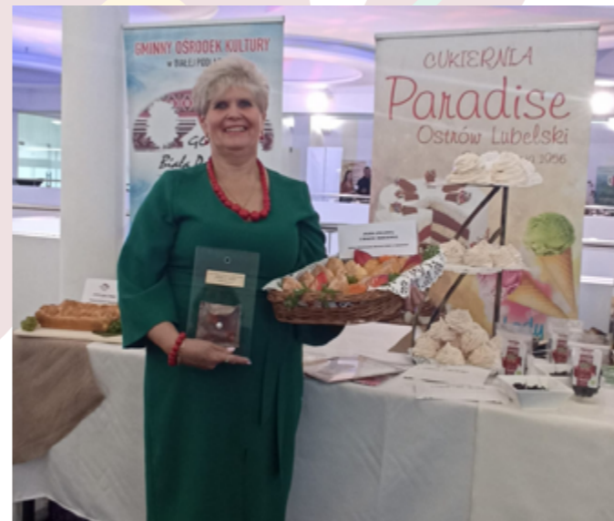
Międzynarodowe Targi w Poznaniu, 09.2022r.