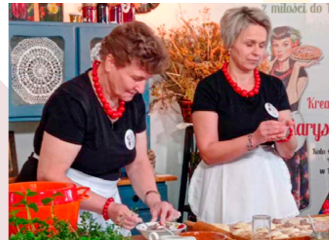
Nagranie do programu „Smacznie i tradycyjnie po lubelsku”, Fajslawice, 18.03.2023r.